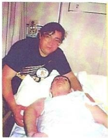
His father cares for him. Su padre lo cuida.